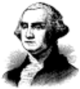
George Washington- Erster Präsident und Vater der Verfassung der Vereinigten Staaten